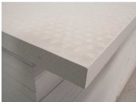
Struktura povrchu desek zabezpečuje velmi pevné lepené spoje.

Žárovzdorné izolační desky Super-Isol se používají na výstavbu krbů, kachlových kamen, zděných kamen, tepelnou izolaci kominových těles a podobně. Vyrábí se v rozměrech 1000x610 mm v tloušťkách 25, 30, 40, 50 a 100 mm o objemové hmotnosti 260 kg/m 3 . Jsou vhodné na izolaci krbů od svislých stavebních konstrukcí (obvodových stěn, příček a podobně), na vytvoření horní části krbu, kudy odchází horký vzduch do vytápěného prostoru, a také na stavbu kompletní teplovzdušné stavby krbu. Desky mají nejvyšší teplotu použití 1000°C a nepoužívají se v místech s přímým kontaktem plamenem, ani v místech více mechanicky namáhaných.